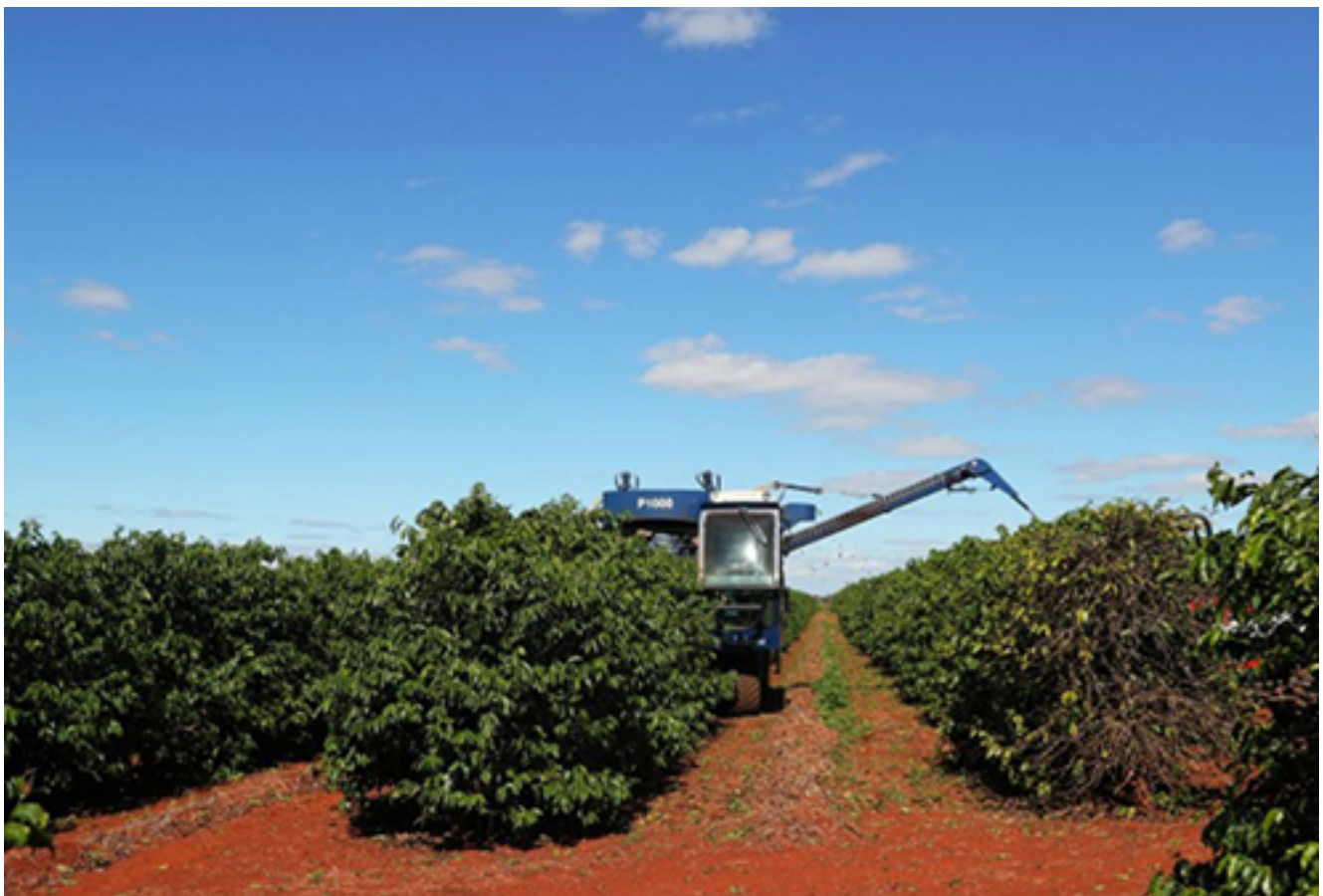
Máy thu hoạch tại vườn cà phê Brazil.

Colombia và Trung Mỹ, cà phê thế giới được trồng ở vùng sản xuất khi nền việc thu hoạch bằng máy gặp khó khăn do vậy phải sử dụng sức người. Điều này khiến giá cà phê sẽ cao hơn vì chi phí sản xuất tăng. Trong khi đó, châu Phi chủ yếu tập trung các nông dân trồng cà phê quy mô nhỏ khó có thể chi trả kinh phí cần thiết mua thiết bị - kỹ thuật mới.